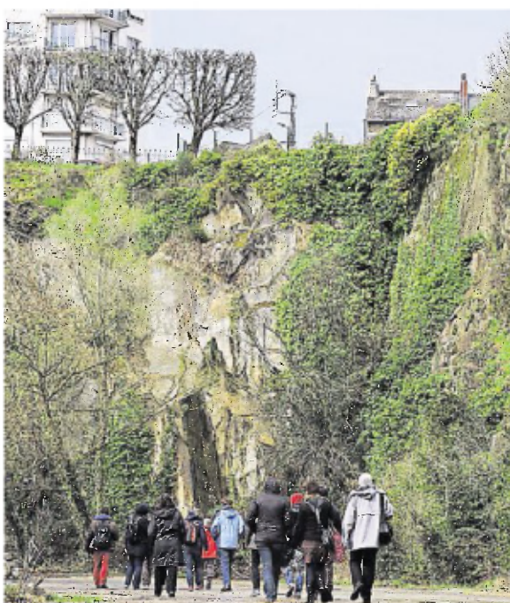
La carrière de Miséry : « un projet très intéressant ».

« C'est un village oublié, une histoire extraordinaire de télescopage entre le pont de Chevire, les grues, les silos et le village lui-même. Un particularisme qui fait traiter comme tel, en essayant d'atténuer le trafic de