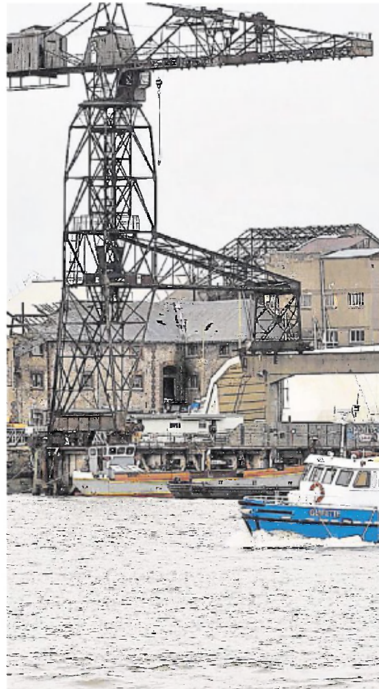
La grue noire du chantier Dubigeon, élément emblématique.

L'urbaniste Bernard Reichen (agence Reichen & Robert) a présenté les lignes directrices émergeant d'un travail d'inventaire et d'analyse de ce territoire de 150 d'hectares où travaillent 3 000 personnes, qui compte 5 000 habitants et dont le passé et le présent industriels sont riches. Et ce en lien avec la Loire, avec d'anciens chantiers navals, un ancien habitat ouvrier campé sur les limites du Sillon de Bretagne et une gare stratégiquement placée. « Ce quartier doit avoir une forte ambition éco-